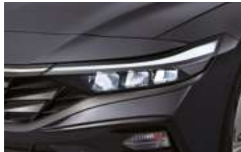
Жарықдиодты фаралар (MFR)