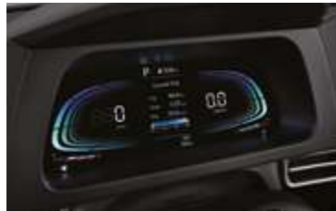
Аспаптар комбинациясы (4,2 дюймдік түрлі түсті СК-дисплей)