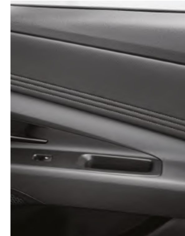
Салон жұмсақ реңктерде тысталған Жолаушы жағынан алдыңғы панельді және есік панельдерін әрлеу үшін премиум класты материалдар қолданылады.

Заманауи дизайн және экологиялық таза материалдар таңдаулы және нәзік атмосфера жасайды.