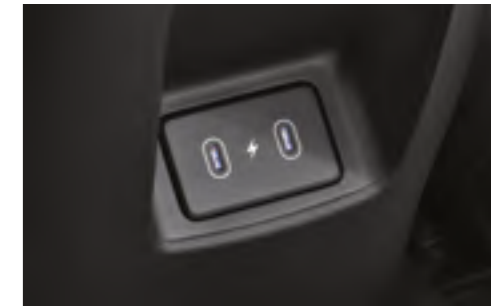
Екінші қатардағы мобильді құрылғыларды зарядтауға арналған USB Type-C қосқышы