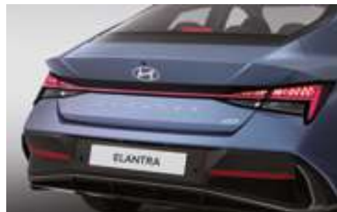
Жарықдиодты артқы аралас шамдар