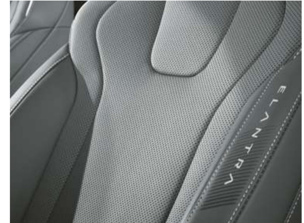
Жасанды былғарымен қапталған орындықтар Премиумдылық сезімін тудыратын экологиялық таза шешім.