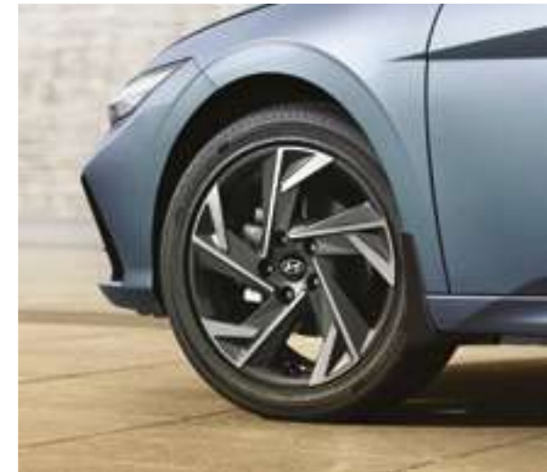
17-дүймдік жеңіл балқығыш дөңгелек дискілері және шиналар