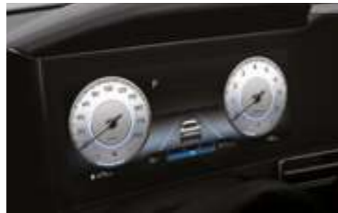
Аспаптар комбинациясы (10,25 дюймдік түрлі түсті СК-дисплей)