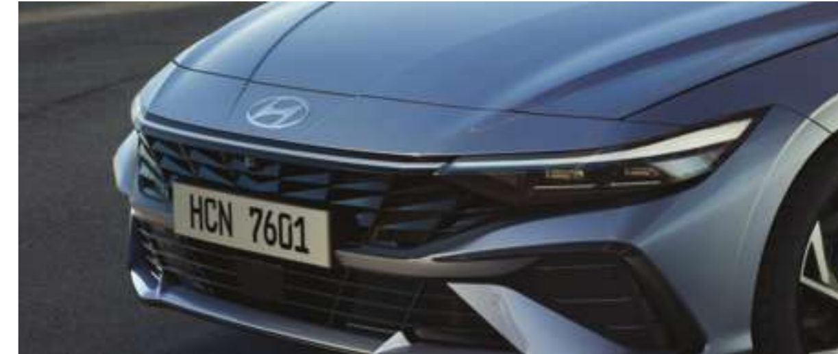
Күндігі жарық шамдарының жіңішке жарықдиодты жолағы