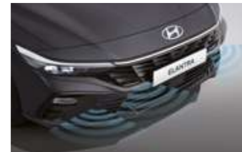
Алдыңғы және артқы тұрақ датчиктері