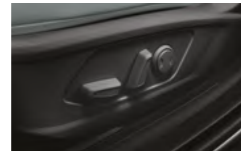
8 бағытта реттелетін электр жетегі және бел тірегі бар жүргізуші орындығы