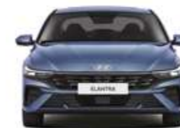
Артқы жолтабан Габаритті ені

Өлшем бірліктері: мм, жолтабан ені 16 дюймдік шиналар кезінде, жақшада — 17 дюймдік шиналар кезінде.