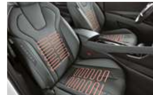
Алдыңғы және артқы орындықтарды жылыту