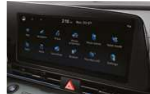
10,25 дюймдік мультимедиялық жүйенің дисплейі