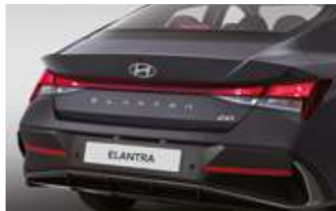
Галогендік артқы аралас шамдар