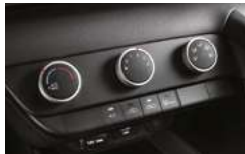
Қолмен басқарылатын климаттық қондырғы