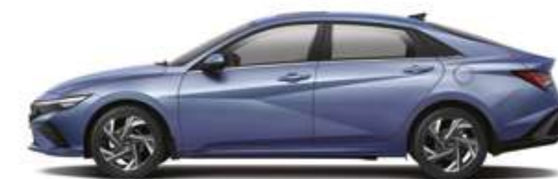
Дөңгелек базасы Габаритті ұзындығы