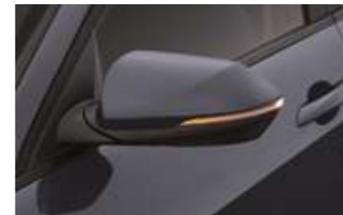
Жылытылатын, жиналмалы және реттелетін электр жетегі және бұрылыс көрсеткіштерінің жарықдиодты қайталағыштары бар сыртқы артқы көрініс айналары