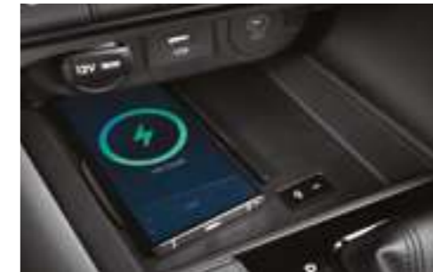
Смартфондарды сымсыз зарядтау жүйесі