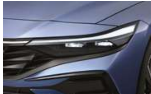
Күндізгі жарық шамдарының жіңішке жарықдиодты жолағы