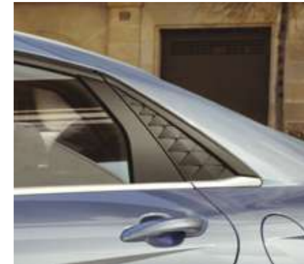
Артқы бүйірлік терезенің сәндік жапсырмасы