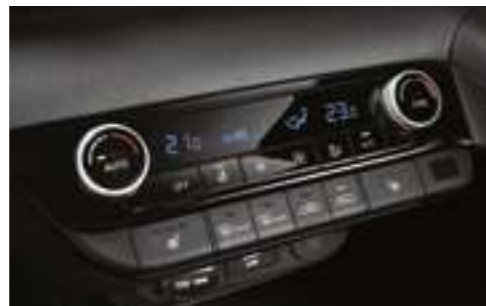
Автоматты басқарылатын екі аймақтық климат-бақылау