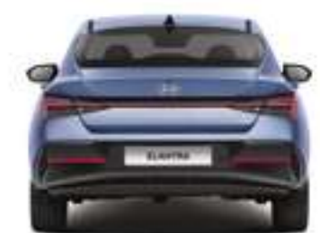
Артқы жолтабан Габаритті ені