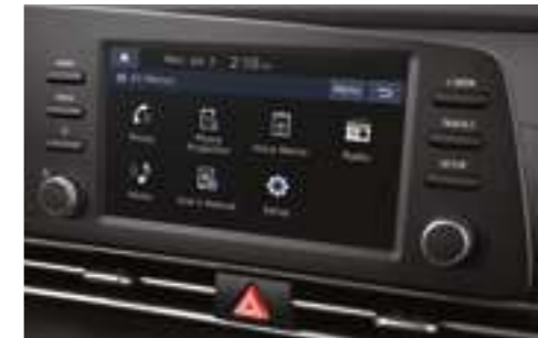
8 дюймдік мультимедиялық жүйенің дисплейі