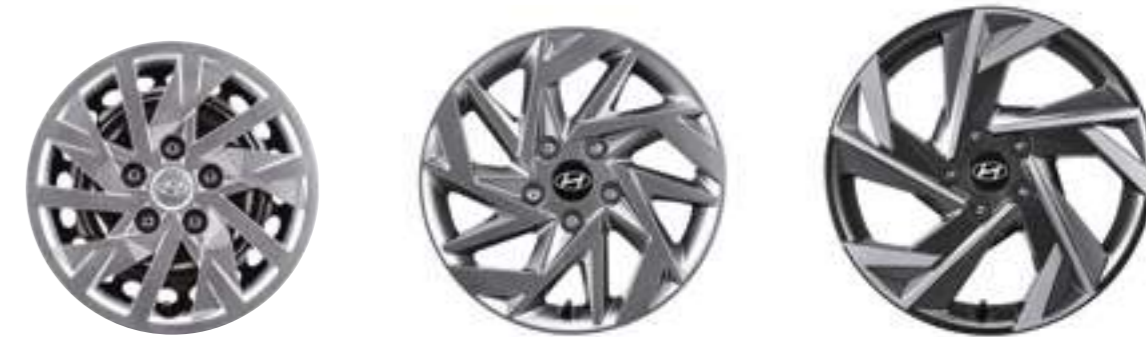
15-дюймдік болат дөңгелек дискілері